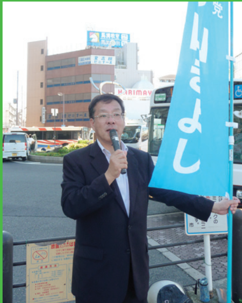
南海高野線 三国ヶ丘駅前